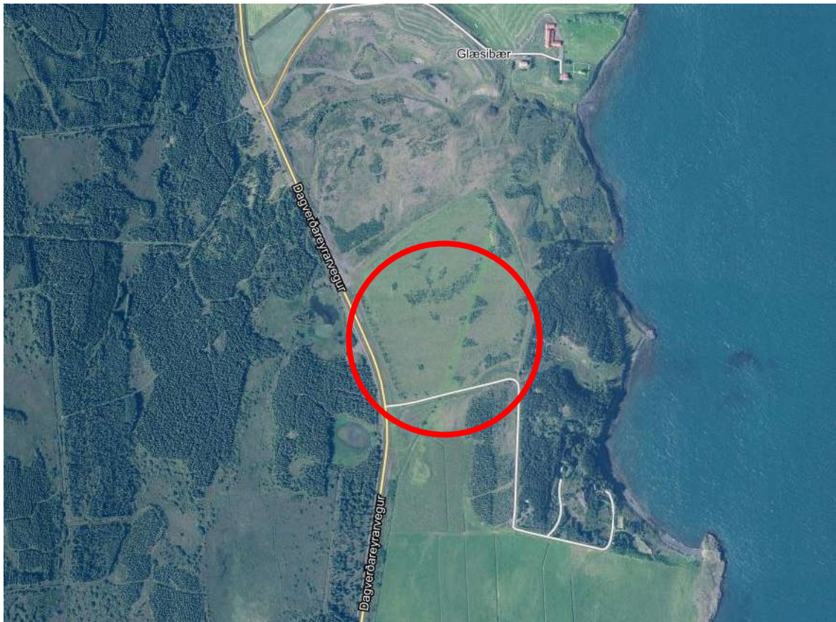
Mynd 1.0: Yfirlitsmynd af svæðinu. Deiliskipulagssvæðið merkt með rauðum hring. www.map.is