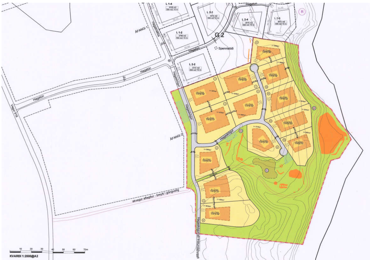
Mynd 1.1: Gildandi deiliskipulag Kollgátu efh fyrir aðliggjandi svæði (áfangi 2) austan skipulagssvæðisins