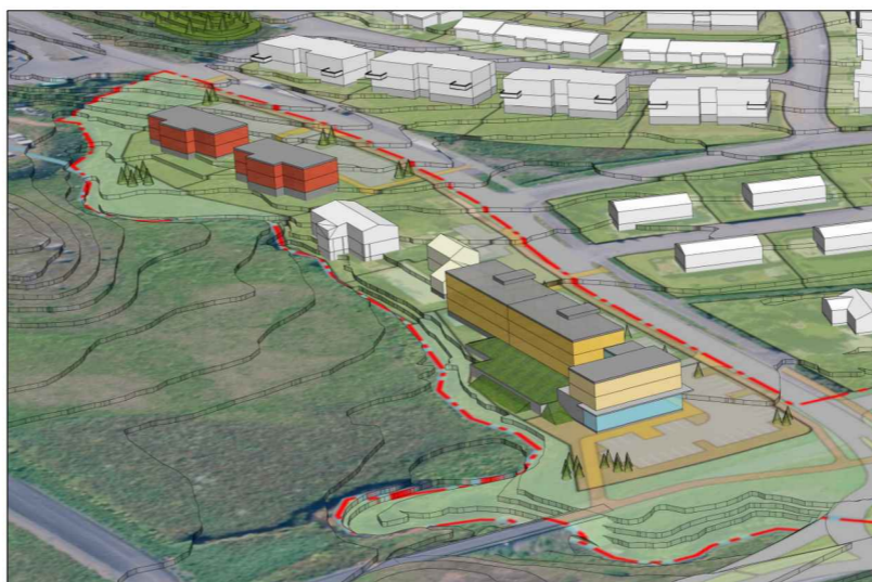
Horft úr suðaustri