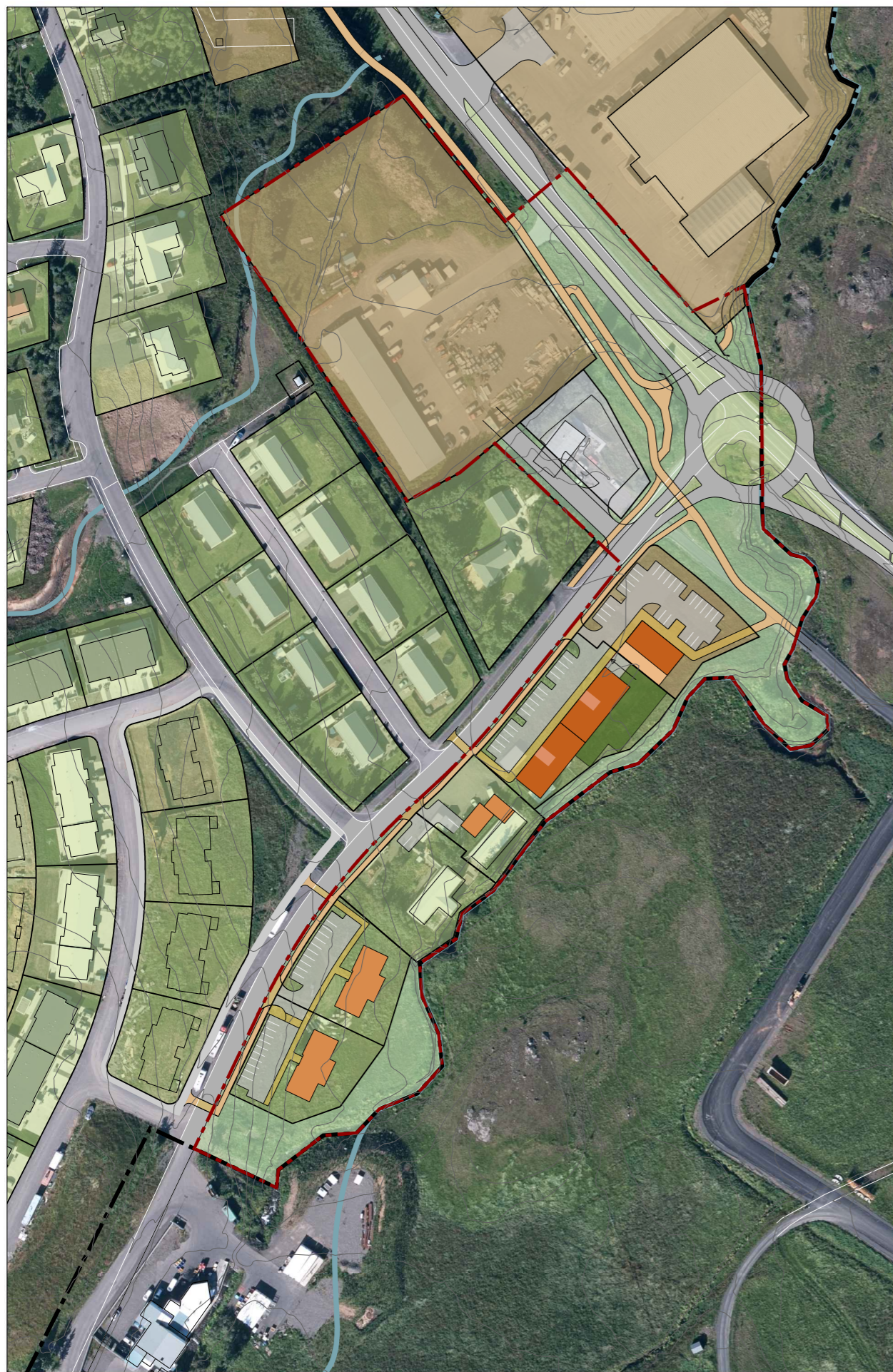
Skýringaruppdráttur, afstöðumynd. Mkv.: 1:2000