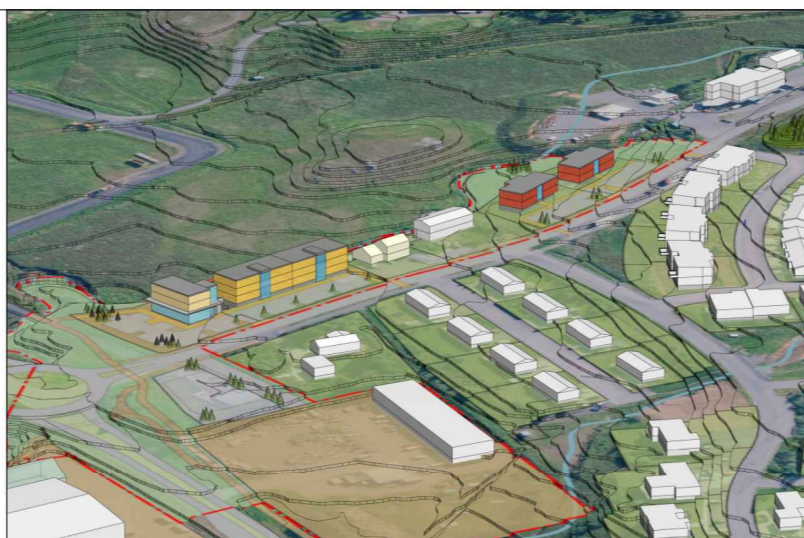
Horft úr norðaustri.