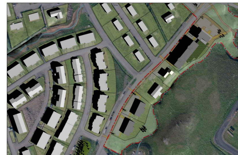
Skuggavarp kl. 10.00 að morgni 21. apríl og 21. ágúst.

Skýringarmyndir við tillögur að breytingum á deiliskipulagi Lónsbakka: