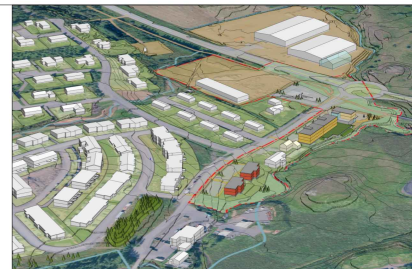
Horft úr suðvestri.